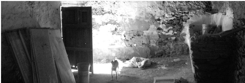
Estado actual de las cuadras de una vivienda para reformar en Alconchel (Badajoz).

Suena la lluvia. Por las rotas tejas y las tablas verdes se adivina la niebla. Los muros desnudos de cal muestran las piedras que lo conforman. El suelo es tierra, la luz entra y enseña el mapa compuesto por las capas de material. Un pequeño perro me observa y da la escala de lo que antes fuera un pesebre. Aguantan el tiempo pero saben que ha llegado su momento. Lo que no es no puede ser, pero el eco de su existencia es la llave del posible futuro. Esto es la Arquitectura Rural, lo quebradizo que aguanta y que debes entender. Huyo del respeto directo a lo viejo, entiendo que existe un substrato, pero ése debe ser el inicio del trabajo, un eco que escuchas, pero puedes bucear en él y modificarlo ya que no está inmóvil, momificado. El mundo está vivo y nosotros marcamos su evolución, no es sencillo transitar por el terreno de lo frágil, pero el reto es el cambio manteniendo lo que verdaderamente importa, lo que es sustrato. Te agarras a lo que conoces pero nuestro presente está ahí, escuchando lo que decimos y soportando lo que hacemos. Debemos siempre revisar nuestros puntos de referencia, ya que en torno a ellos gira el conocimiento.