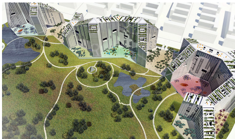
Future Towers, Pune, India by MVRDV