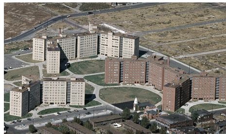
Vaughan Public Housing Complex, St Louis, USA by Leinweber, Yamasaki & Hellmuth

1. Future Towers, MVRDV 2011; http://www.mvrdv.nl